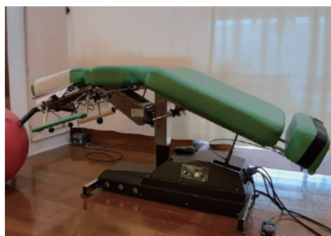
自動、他動で動く多機能ベッドです。施術者が関節を固定し、ベッドが動くことで、軽い力で関節の牽引が可能です。