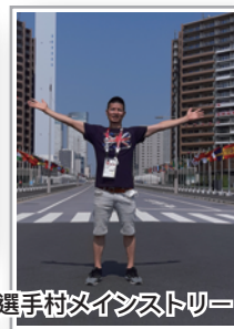
選手村メインストリート