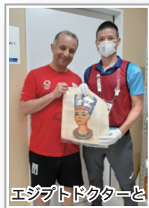
エジプトドクターと

人生をかけて今大会の為に準備し、キラキラと輝くオリンピック達を、微力ながらもサポートさせて頂き、鍼灸師として大きな糧となりましたし、エネルギーも頂きました。自分自身の鍼灸術をもっと高めると共に、スポーツ業界や地域医療において鍼灸の素晴らしさ、役割を広報し、これをレガシーしたいと思います。