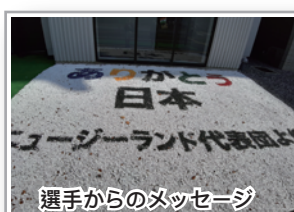
選手からのメッセージ