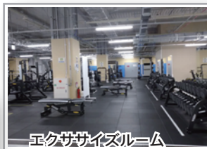
エクササイズルーム