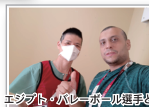
エジプト・バレーボール選手と