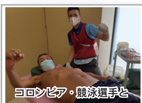
コロンビア・競泳選手と