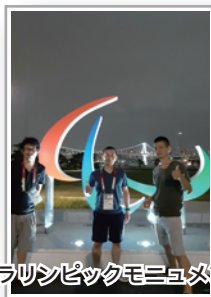
パラリンピックモニュメント