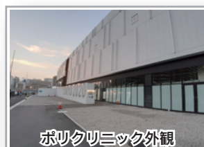
ポリクリニック外観