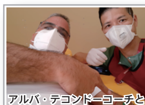
アルバ・テコンドーコーチと