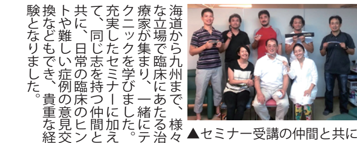
▲セミナー受講の仲間と共に

グラストンテクニック 一鍼灸院を受診された方は、一度はステンレスの棒でゴリゴリとされる治療を受けられた方も多いのではないのでしょうか？ グラストンテクニックはアメリカを中心に広がる「筋膜」の治療方法です。カラダの錆(さび)を取り除いて、筋肉の機能の回復を行います。