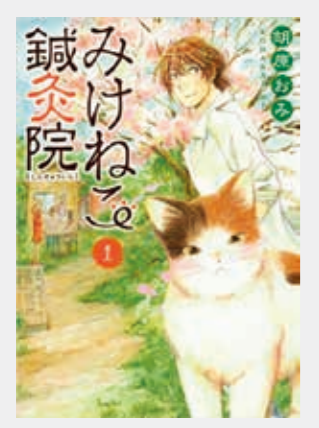
みけねこ鍼灸院 胡原おみ・作

鍼灸治療を受けた方から、「腰 が痛いのにどうして足に針をする のですか？」「脈や舌を見て何がわ かるのですか？」などの質問を多く いただきました。 私たちの行う鍼灸治療は、数千年 前から先人たちが積み上げてきた経 験に基づく治療方法が基礎にあり、 現代医学的な解剖学や生理学を組み 合わせて治療を行っています。徐々 に解明されつつある東洋医学の世界 ですが、学問的に理解しようとすれ