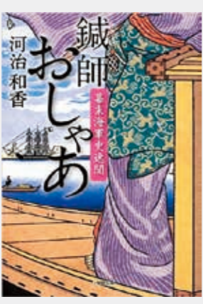
鍼師おしゃあ 河治和香・作