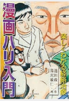
漫画ハリ入門 池田政一・作