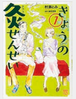
きょうの灸せんせい 村瀬とみ・作