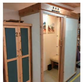
更衣室 &amp; ロッカー