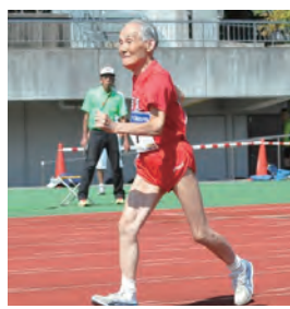
▲103歳の宮崎選手（マスターズ陸上）

介護予防運動 一鍼灸院の理念の一つでもある「人らしく生き、人らしく死ぬる社会作り」の実現に向けて、今年「介護予防事業」を始めます。 ここ、名張市においても、高齢化率（65歳以上の人口）が約22%。この10年間で3倍の伸び率で推移し、10年後に30%、30年後には40%に届くと予測されています。今後、私たちはどのようにこの社会を維持し、発展させていくのかが問われています。 先日テレビをつけていると、マスターズ陸上の様子が放映されていました。